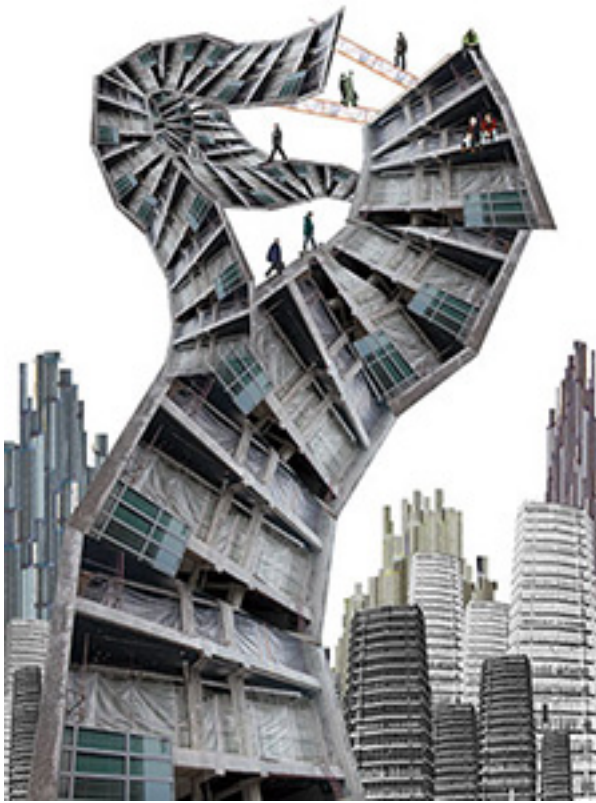
Urbis - profilo di palazzo